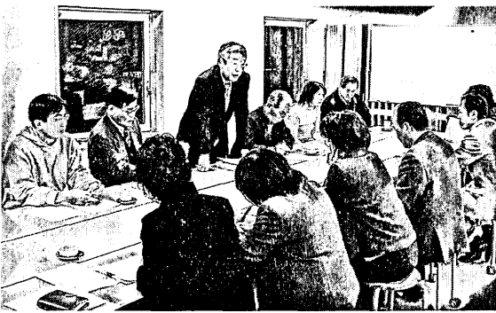
【社会教育委員の会議の様子】

委員の会議は年に数回開催されるが、それとは別に、各部会が社会教育委員の「自主検討会」として月1回程度、報酬の支払いを受けずに、学習会を行っている。