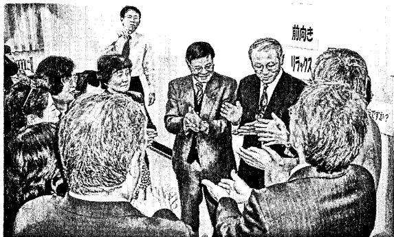
【自主研修「ワークショップで事業評価」の様子】

平成18年度の社会教育委員の研修については、大きく9種類の研修会があった。その研修に延べ41名が参加している。1人当たり2〜3回の研修参加ということになる。中には隣接の市で行われる社会教育委員の自主