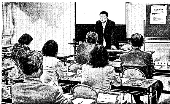
【社会教育委員の自主学習会の様子】

社会教育委員が会議に出席して意見を述べるだけでなく、部会を設けて意見交換をしやすくしている。また、委員が社会教育主事等の研修会に参加することによって専門的知識・技術を身につけるとともに、実際の事業を見学し自らの知っている世界を広げた。このことを通して、社会教育に対する理解を深め、委員の活動を見直し、しかも、部会単位で発足した「自主的勉強会（自主検討会）」をもとに、