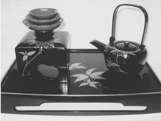
写真1 木製 黒 胴張四ツ揃 万両 屠蘇器 (所有品)