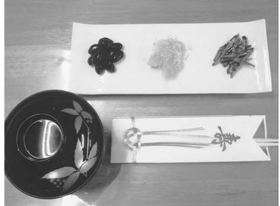
写真2 奥 祝い肴三種 左から黒豆、数の子、田作り 手前 左 雑煮碗 右 祝い箸