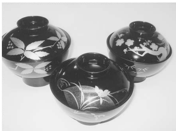
写真3 雑煮椀（所有品）左から 黒 雑煮椀 南天 黒 雑煮椀 扇面 蘭 黒 雑煮椀 松竹梅

お雑煮は、お正月の三が日の「ハレ（晴れ）」の食事であるが、これも場所により、元日だけや、三日とも食べないなど風習に違いがある。