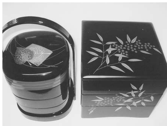
写真4 重箱（所有品） 左 手提胴張 三段重 玉葉 kansai urusi (山本寛斎 漆) 右 木製重箱 (会津塗) 黒内朱 三段重 南天