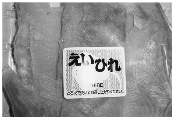
写真8 干しえい (東京)

る。栃木県では、那須高原の郷土料理として“干えい”“かすべ”の料理がでており、海がなく新鮮な魚が入手しづらい地域であったためではないかと思われる。関西方面、九州方面においても“えい”は食されているようではある。