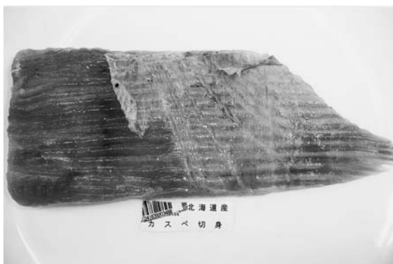
写真7 生かすべ (東京)