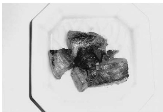
写真6 干しかすべの煮つけ (秋田)