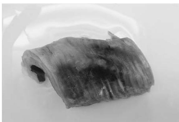
写真5 戻したかすべ (秋田)