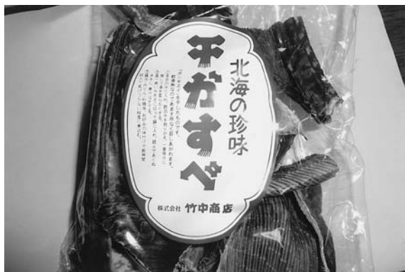
写真3 干しかすべ (秋田)