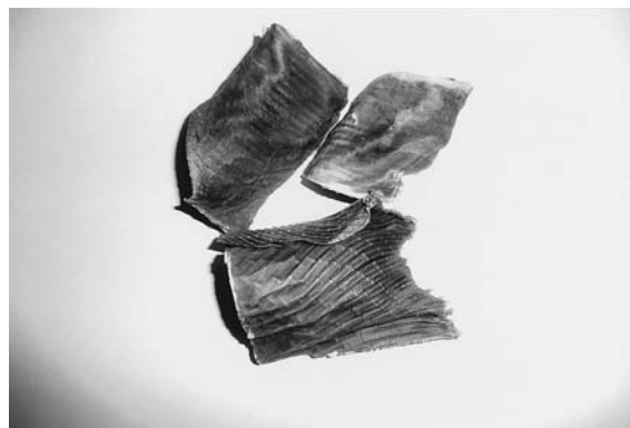
写真4 干しかすべ (秋田)