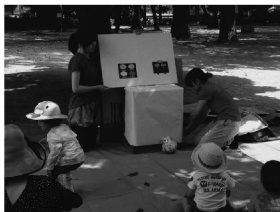
写真2 野外でパネルシアター

ゲスト・コーナーは、社会教育会館にとってはアウトリーチ活動となっており、室内ではなく野外でのインフォーマルな学びを構成している。また、おそとカフェの中に講座を融合することで、講座が終わった後もおそとカ