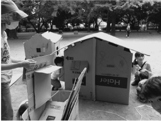
写真3 野外でダイナミックに段ボール遊び